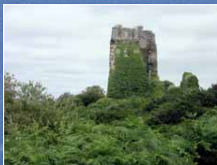
Le Donjon de Trémazan

Le donjon de Trémazan à Landunvez 10 12, est un héritage du XIV ème siècle constituant un témoignage rare sur l'architecture militaire et seigneuriale en Bretagne. Le château fut habité jusqu'à la fin du XVI ème siècle par la famille Du Chastel dont plusieurs membres s'illustrèrent dans l'histoire du duché de Bretagne et de la monarchie française.