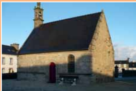
La chapelle de Milizac