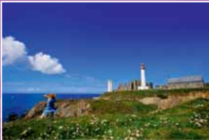
La pointe Saint-Mathieu

A visiter : le phare, le musée, l'abbaye et le cénotaphe.