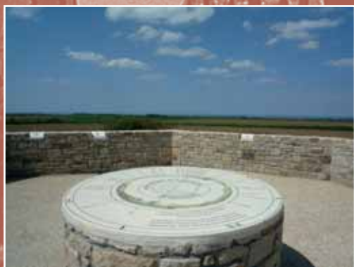
Le belvédère de Kéramézec

Au belvédère de Kéramézec à Ploumoguier 4 , vous êtes au point culminant du Bas Léon, à une hauteur de 142 mètres, avec une vue imprenable sur tout le Pays d'Iroise et l'archipel de Molène. Suivez le parcours d'interprétation ludique, jeux de questions-réponses sur les points les plus hauts de France, pour atteindre la table d'orientation située au sommet de la butte.