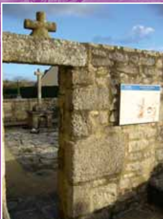
Le Cimetière des Saints

Le calvaire du cimetière, construit au XVIII ème siècle, a été inscrit à l'inventaire des Monuments historiques en 1930.