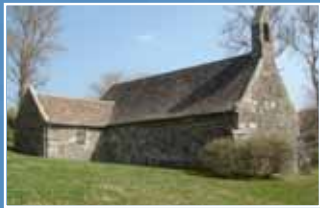
La Chapelle de Loc-Méven à Ploumoguier