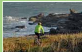
La randonnée découverte

Hébergement : → Restauration : X Alimentation : ☒