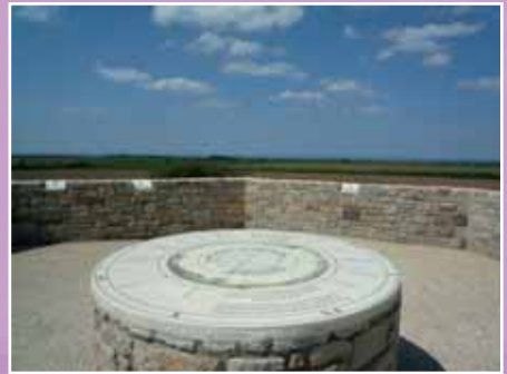
Le belvédère de Kéramézec

Ports d'embarquement pour Molène et Ouessant : Le Conquet, Brest et Lanildut l'été.