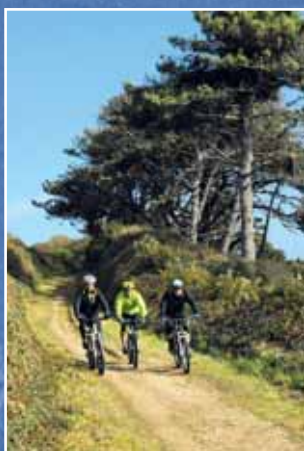
"Le VTT, c'est aussi une sortie entre copains..."

La chapelle de Kersaint à Landunvez 10 11 12 est liée à l'histoire de la famille Du Chastel, seigneur de Trémazan. A voir également sur la commune pour compléter l'histoire de cette famille : la maison des Chanoines et la fontaine Sainte-Haude.