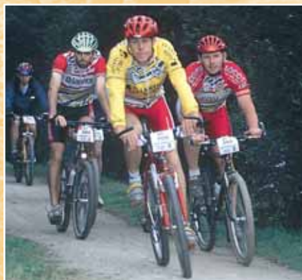
Un parcours sportif et historique

Le calvaire du cimetière a été inscrit à l'inventaire supplémentaire des Monuments historiques en 1930.