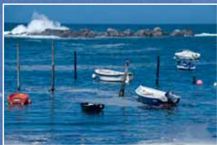
Le port de Mazou

Une petite trentaine de troncs d'arbres de 8 à 10 mètres de hauteur sont plantés dans le sable marin, avec leurs racines, au creux d'une petite anse refermée par des pointes rocheuses. Des pierres consolident la base de chaque arbre et l'ensemble constitue une petite forêt de mâts qui traverse les siècles. C'est là que s'amarrèrent les embarcations.