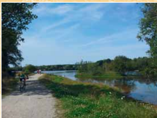
Lac de la Comiren à Saint Renan

Les lacs de Saint Renan 5 6 7 à la fin des années 1950, l'Etat découvre un important gisement de minerai d'étain. Quelques années plus tard, la Compagnie Minière de Saint Renan (COMIREN) démarre les extractions.