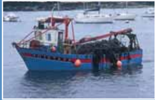
Le charme des ports de pêche