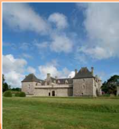
Le château de Kergroadez

Le château de Kergroadez à Brélès 13 14 15 édifié par le marquis François III de Kergroadez est un classique de l'architecture défensive et de la Renaissance bretonne. Classée Monument historique depuis 1992, cette vaste demeure, construite en granit de l'Aber Ildut, est aujourd'hui progressivement restaurée. Des visites et des animations sont organisées toute l'année.