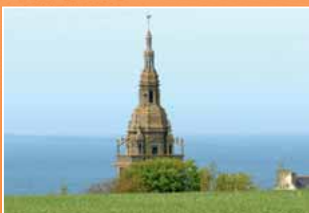
L'église Saint Pol Aurélien

L'église Saint Pol Aurélien à Lampaul-Ploudalmézeau 15 est dédiée à Saint Pol Aurélien, qui débarqua de Grande-Bretagne dans le nord du Finistère vers 512 et fut le premier évêque du Léon... Le clocher-porche de l'église a été inscrit à l'inventaire des Monuments historiques en 1926.