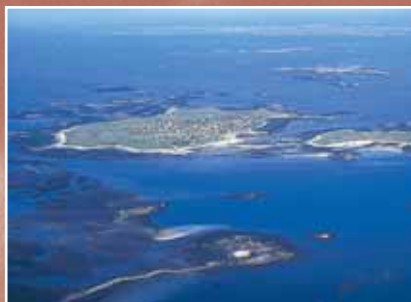
L'archipel de Molène en Mer d'Iroise

Partez à la découverte du Conquet en suivant le parcours "5 siècles de Pierres et de Mer". (renseignement Office de Tourisme)