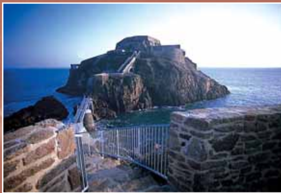
Le Fort de Bertheaume