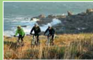
Une sortie entre amis